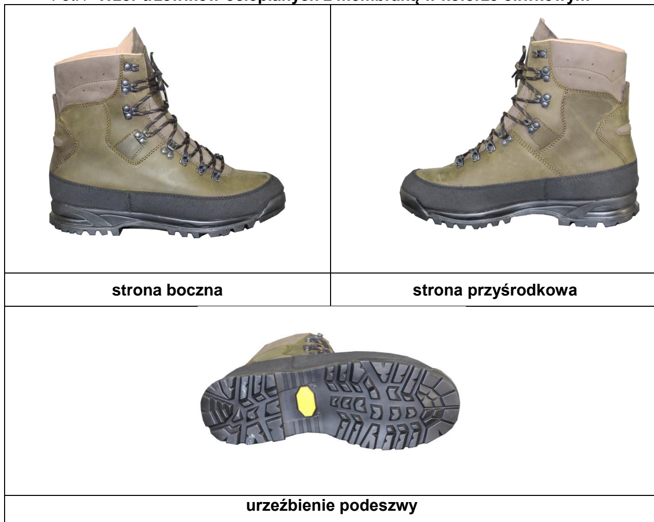
Fot.1 Wzór trzewików ocieplanych z membraną w kolorze oliwkowym